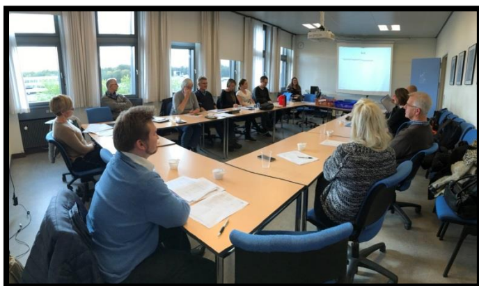
Møde i Dansk CancerBiobank den 26. oktober

Dansk CancerBiobank og Dansk ReumaBiobank har holdt faglig følgegruppe møder med konstruktive diskussioner og mange nye spændende tiltag.