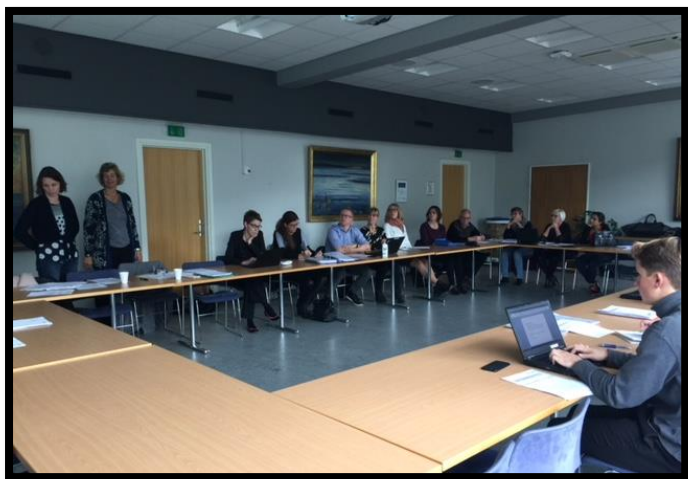
Møde i Dansk ReumaBiobank den 31. oktober